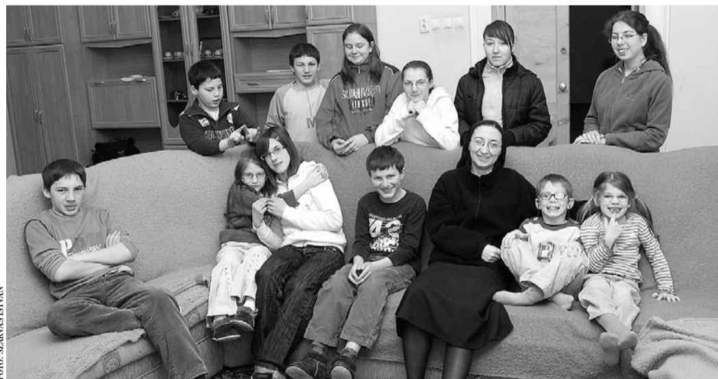
A nővérek nem adják fel, hiszen egyre több a rászoruló

Mint elmondják, Makláron kezdték gyakorolni hivatásukat, de végül ott nem, csak Mezőkeresztesen sikerült megvetni a lábukat. Két tágas, szép épületet újjítottak fel lassú, türelmes munkával, amelyek – sajnos – jelen-