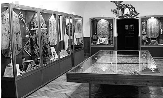
Legendás történelmi személyiségekhez kötődnek a kiállított tárgyak

A mezőkövesdi esperesi kerület immár 7. alkalommal megrendezésre kerülő programján a környék római katolikus énekkarai mellett vendégként meghívót kapott a bükkzsérci és a Miskolc-szirmai református kórus is.