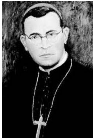
Nagyváradon hirdették ki boldoggá avatását

A boldoggá avatással kapcsolatos anyaggyűjtést 1995-ben kezdték, és másfél évig tartott. Az eljárás csaknem 900 oldalas jegyzőkönyve 1997-ben került Rómába, ahol azt egy hét teológusból, bíborosból, érsekből álló