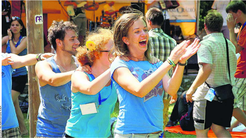
Nemcsak az Egri Főegyházmegye területéről, hanem az egész országból, sőt a határon túlról is jöttek a fiatalok

– Váratlanul ért a belvárosi plébánosi kinevezés, de mivel huszonöt évet Egerben éltem, ismerem és szeretem ezt a várost. Örömmel vállalom az újabb kihívást. Tisztában vagyok azzal is, hogy az Egri Bazilika nemcsak a városé, hanem az egész főegyházmegyéé. Arra törekszem, hogy színvonalasan folytassuk azt a sokszínű tevékenységet, ami eddig a főplébániát jellemezte. Számítok azokra a világi munkatársakra, akik eddig segítettek elő-