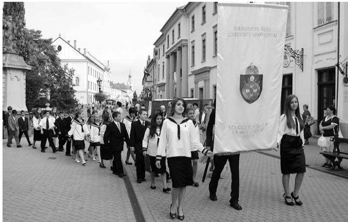
Indulás a Bazilikába. A diákok osztálymiséken, lelki napokon vesznek részt.

Varga B. János igazgató hangsúlyozta: a tantestület az egész ember fejlesztésén munkálkodik. Legfőbb célunk, hogy diákjaik erőt, felelős, szabad és erkölcsileg helyes döntésre képes felnőttekké váljanak. ■ (homa)