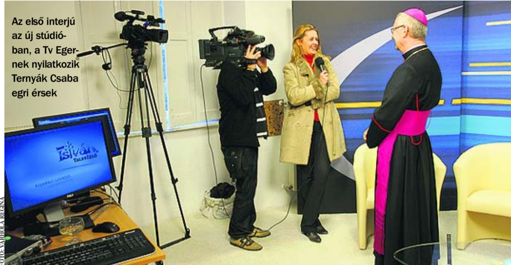
Az első interjú az új stúdióban, a Tv Egernek nyilatkozik Ternyák Csaba egri érsek

(RÉSZLET A SEBTŐL GYÓGYULT CÍMŰ INTERJÚBÓL, MELY 1985-BEN JELENT MEG A HEVESI SZEMLE-BEN. KÉSZÍTETTE: HOMA JÁNOS.)