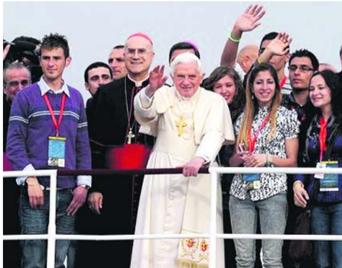
A pápa nagy örömmel köszöntötte a világtalálkozóra összegyűlt kétféle fiatalot, és hangsúlyozta, hogy a világnak szüksége van a hitükre és Istenre

A nemzetközi eseményt lezáró ünnepélyes szentmisén a pápa arra buzdította a jelenlévő kétféle fiatalot, hogy mindenütt tegye-