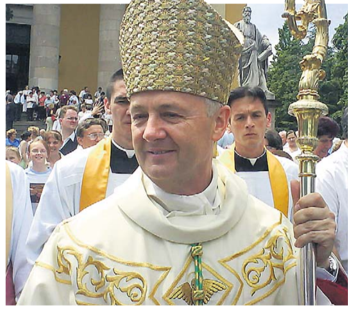
„Egyházmegyénk idén a karitás lelkeségében szeretne elmélyedni”

– Nem volt, és nem is lehetett célja ennek a tematikus évnek, hogy látványos eredményeket érjünk el ezeken a területeken. A